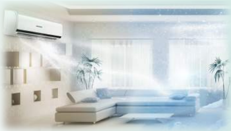
Modo de Enfriamiento Turbo