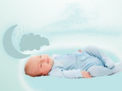
Modo de Sueño