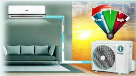
Arrancador de Bajo Voltaje